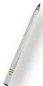
Lápiz de Ojos Negro