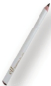
Lápiz de Ojos Marrón