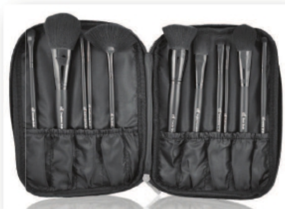
Manta Pinceles (foto no contractual)