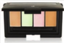
Corrective Concealer (Pack Correctores)