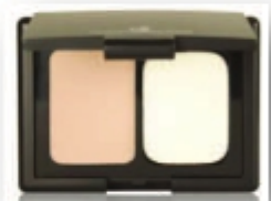
Translucent Powder (Polvos Translúcidos)